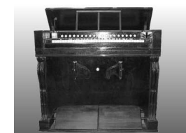
Ensemble Harmonium: Debain 1880