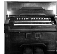
Kunstharmorum: Mustel-Celesta 1904